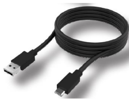
USB-C към USB-A кабел (USB 3.1 Gen 1, 2 метра)