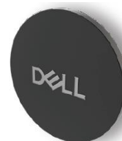
Капаче на камерата (магнитно)