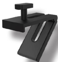
Стойка за камера